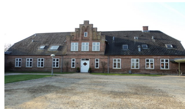
Her startede plejhjemmet i 1961

Personalet på Sommersted Plejehjem byder dig rigtig hjertelig velkommen, vi håber du vil blive